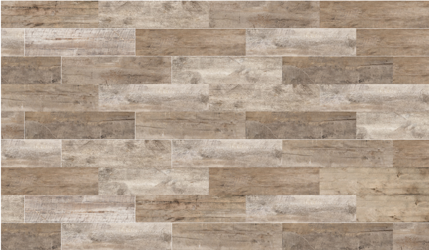
timber 15,5x62 nierektyfikowana