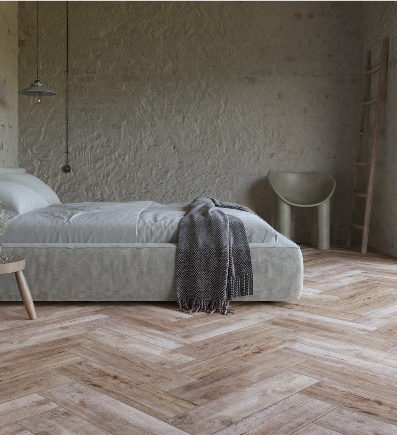
timber 15,5x62 /nierektyfikowana/