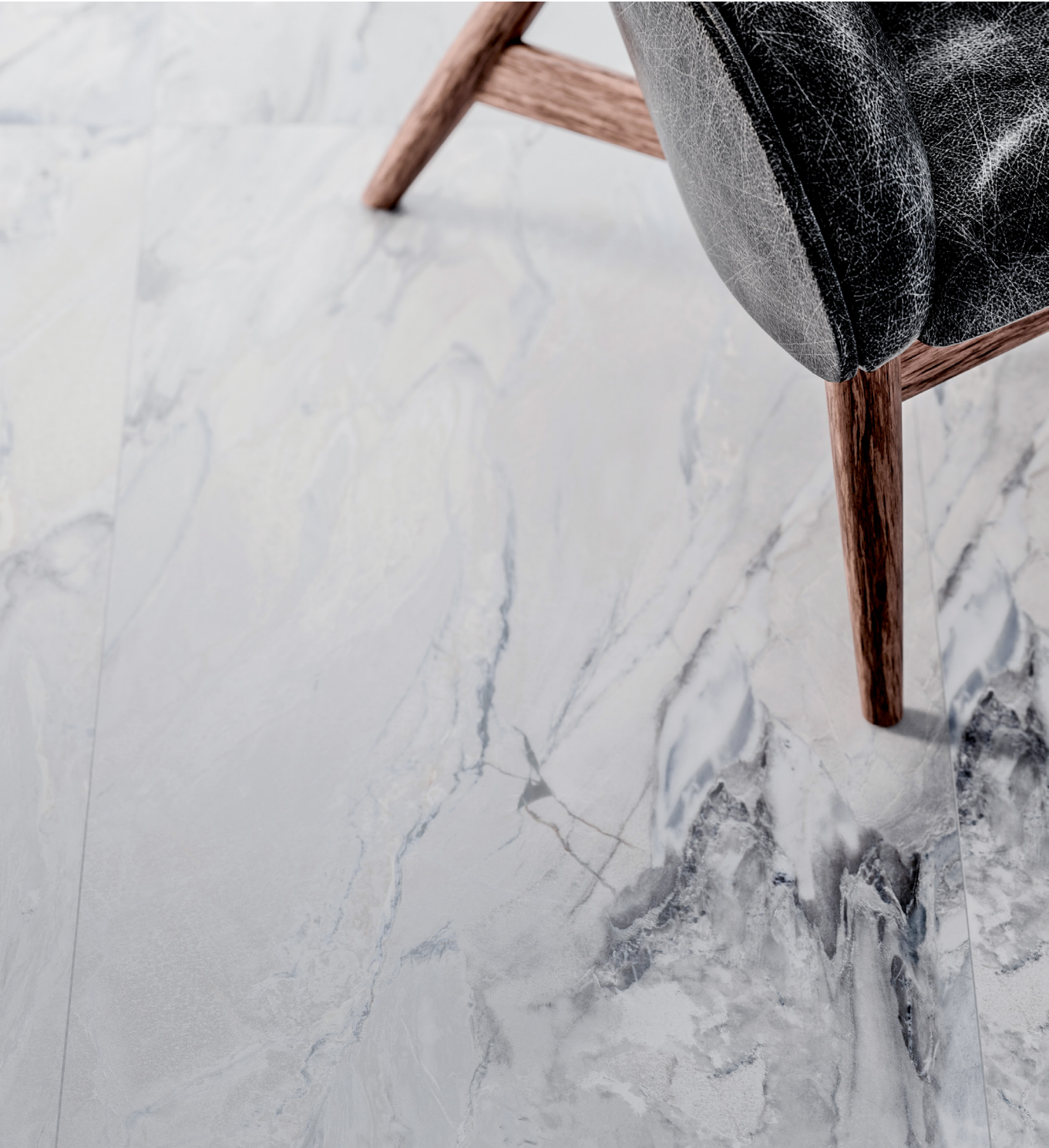
blue jeans 60x120 /rektyfikowana/