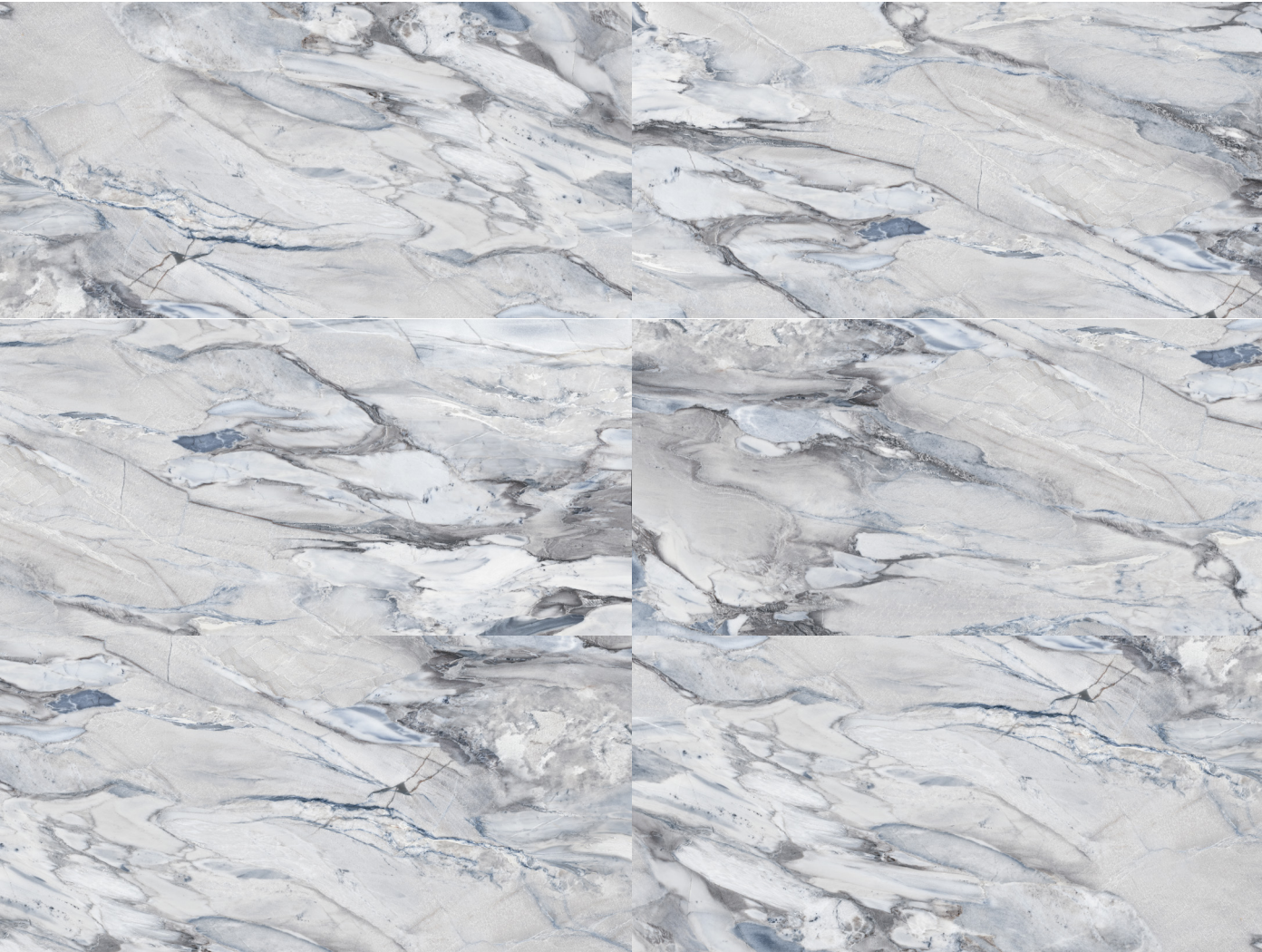
blue jeans 60x120 rektyfikowana